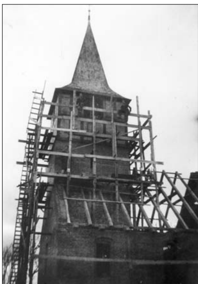
Spiret er ved at være færdigt