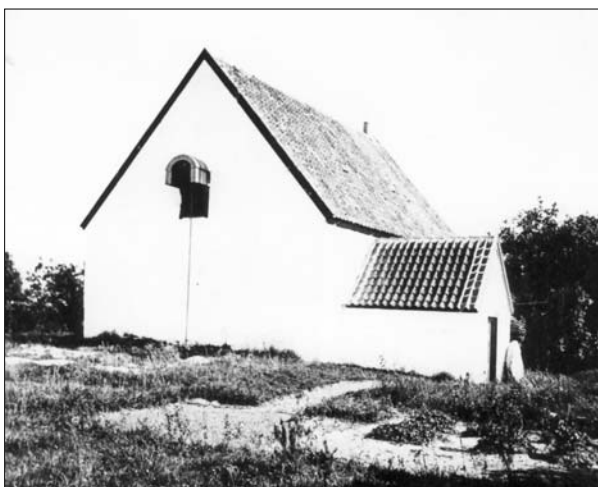
Suldrup Kirke kort før ombygningen