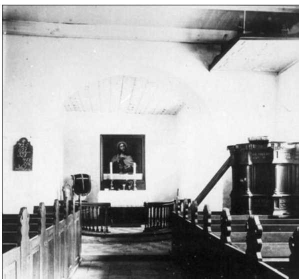
Suldrup Kirke inde ca. 1920