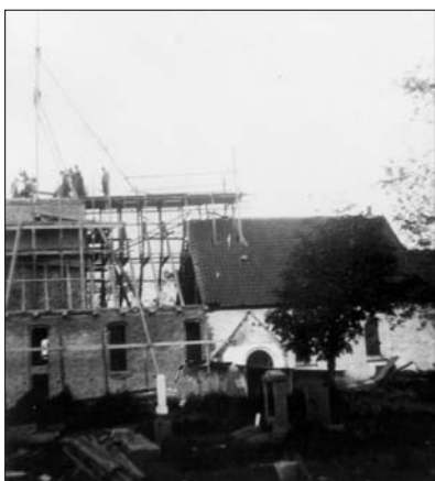
Der gøres klar til at bygge spiret

Den 7. august 1943 begyndte selve arbejdet. Tømret blev leveret og stablet op syd for kirkediget. Det var tørt og vellagret. Profilet, som tømrerne kalder det, blev lavet af brædder på tømmerunderlag, og herpå blev spiret snøret op, så vi kunne få størrelsen på gratherne. De var af 4" x 7" tømmer og 10 m lange - det er dem der danner de fire hjørner af spiret. Gratherne blev sammen med de fire spær, der var 5" x 6", tilpasset kongen, der var af 7" x 7" og derfor ottekantet i øverste ende. Den var 5,60 m og 0,90 m over spiret, hvor den var spidset ned til 4", fordi herpå skulle vindfløjen sidde.