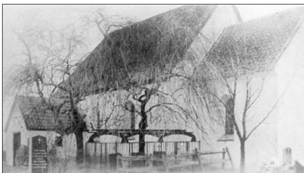
Suldrup Kirke ca. 1920