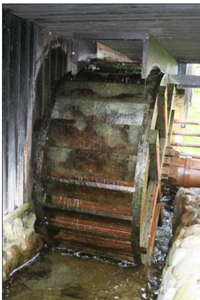
Stående hjul (Halkær)

De første vandmøller var ganske enkle typer kaldet skvatmøller, som i princippet blot var et vandret lille skovlhjul på en lodret akse stukket ned i åen. Akselen kunne så trække en mindre kværn, så man fik malet sit mel.