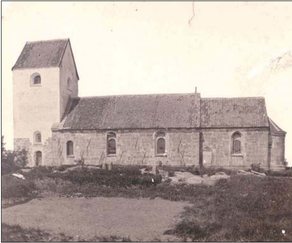
Veggerby kirke ca. 1900